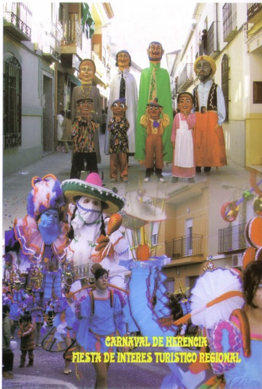
CARNAVAL DE HERENCIA FIESTA DE INTERÉS TURÍSTICO REGIONAL